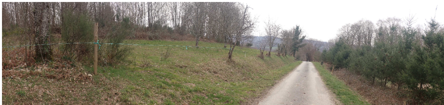
Vue rapprochée 2 : Vue depuis le nord du projet, vers le sud.