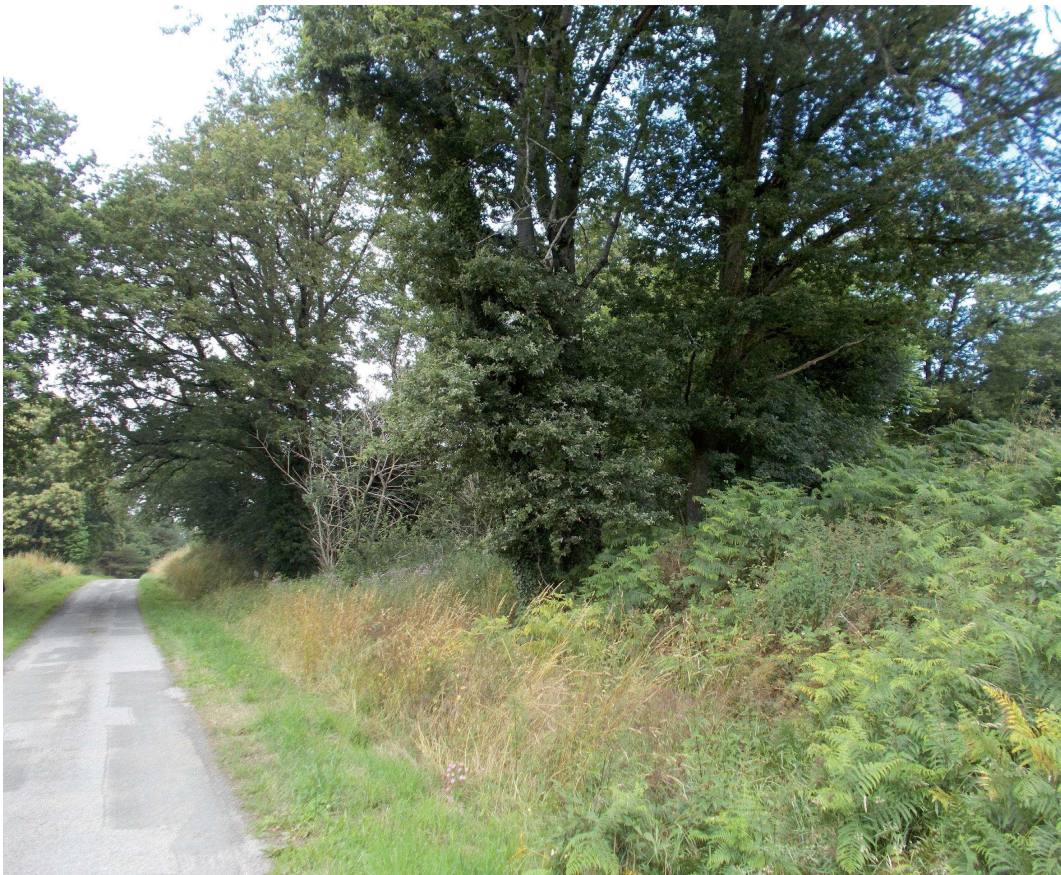
Vue rapprochée 3 : Vue depuis l'est du projet, vers l'ouest.