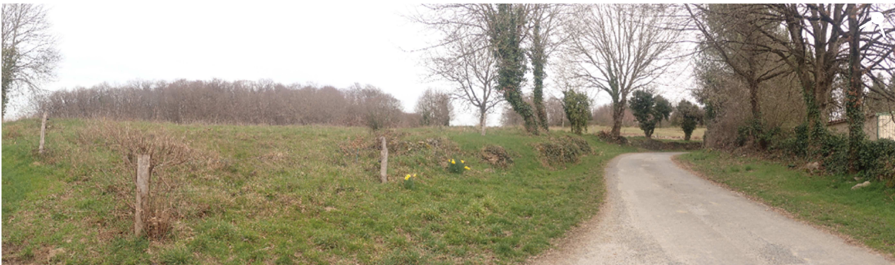
Vue rapprochée 4 : Vue depuis le sud du projet, vers le nord.