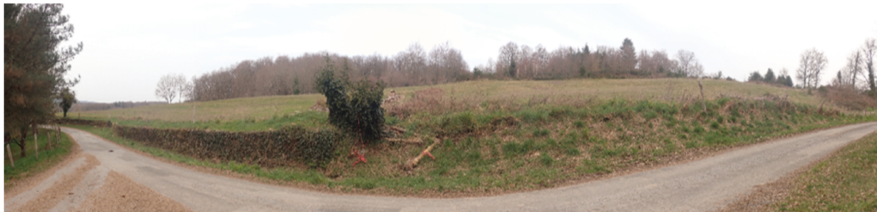
Vue rapprochée 1 : Vue depuis le sud du projet, vers le nord.